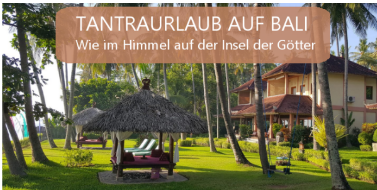
Tantraurlaub auf Bali - "Wie im Himmel auf der Insel der Götter"

05. - 13. März 2027 im Holiway Garden Resort im Norden von Bali - der "Insel der Götter" - mit anschließender Verlängerungswoche (mit Angela Mecking und Ralf Lieder)